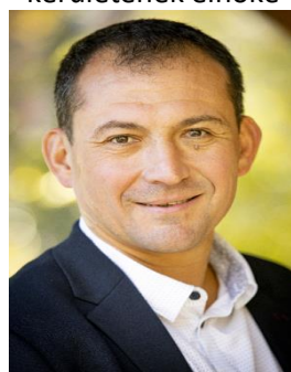
Yann Marot Sauternes polgármestere